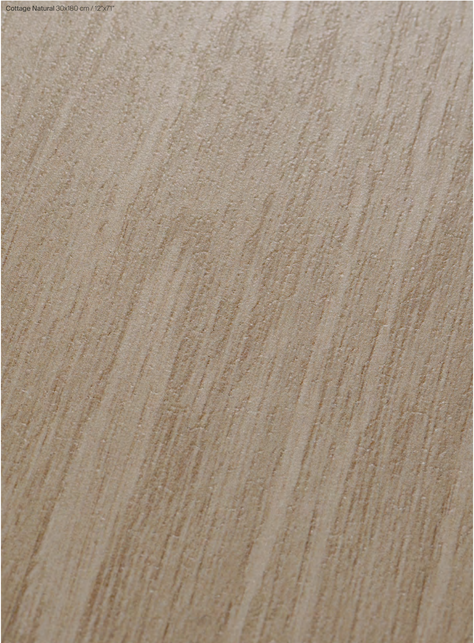
Cottage Natural 30x180 cm / 12"x71"